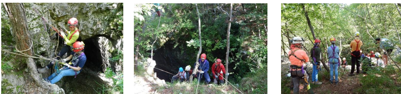
Figura 10: Grotta cacciatori. Uscita pratica con gli scout.

Il weekend del 13 e 14 maggio 2017 abbiamo organizzato un'uscita con gli Scout nell'ambito dell'evento regionale scout "Bottegando". Il Sabato pomeriggio è stato organizzato un incontro teorico per scoprire la speleologia e l'uso dei materiali per la progressione in corda. La domenica invece è stata organizzata un'uscita pratica alla grotta Cacciatori a cui hanno partecipato 10 ragazzi dai 16 anni in su.