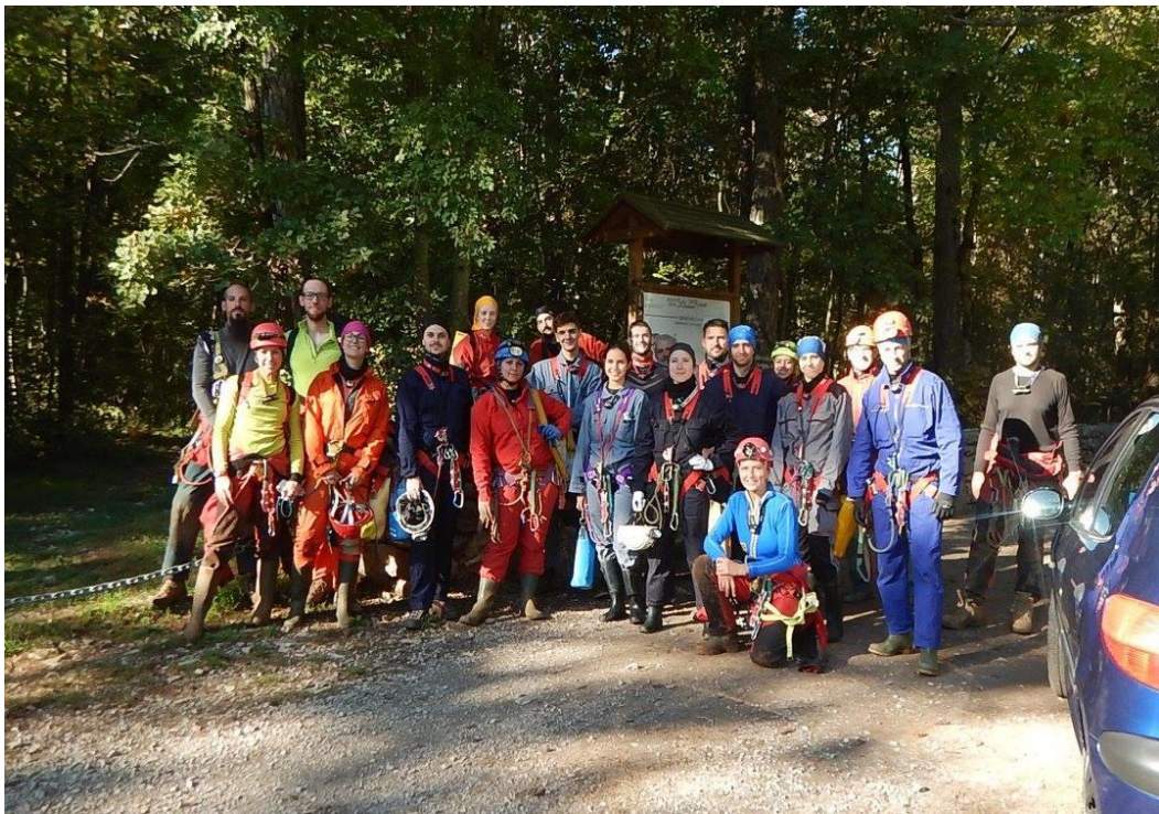
Figura 8: IV^ Uscita del corso di 1° livello in Grotta Padriciano

La Scuola di Speleologia "Ugo Stocker" di Ronchi, in seno alla Società di Studi Carsici A.F. Lindner, ha organizzato dal 21 settembre al 2 ottobre 2017 il 33° corso di progressione in grotta di 1° livello, omologato dalla Commissione Nazionale Scuole di Speleologia della Società Speleologica Italiana, con 10 allievi iscritti: il corso si è articolato in 5 lezioni teoriche e 5 esercitazioni pratiche in cavità del Carso Triestino. È stato chiesto, visto il numero di allievi, il supporto di AI, IT e IS di altre scuole: Forum Julii Speleo, CAT, SAS e Fante.