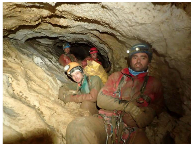
Figura 3: Grotta Clemente.