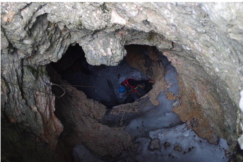
Figura 2: Pala Celar.