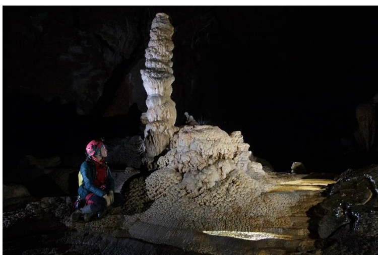
Figura 7: Visita alla grotta Strasna Jama.