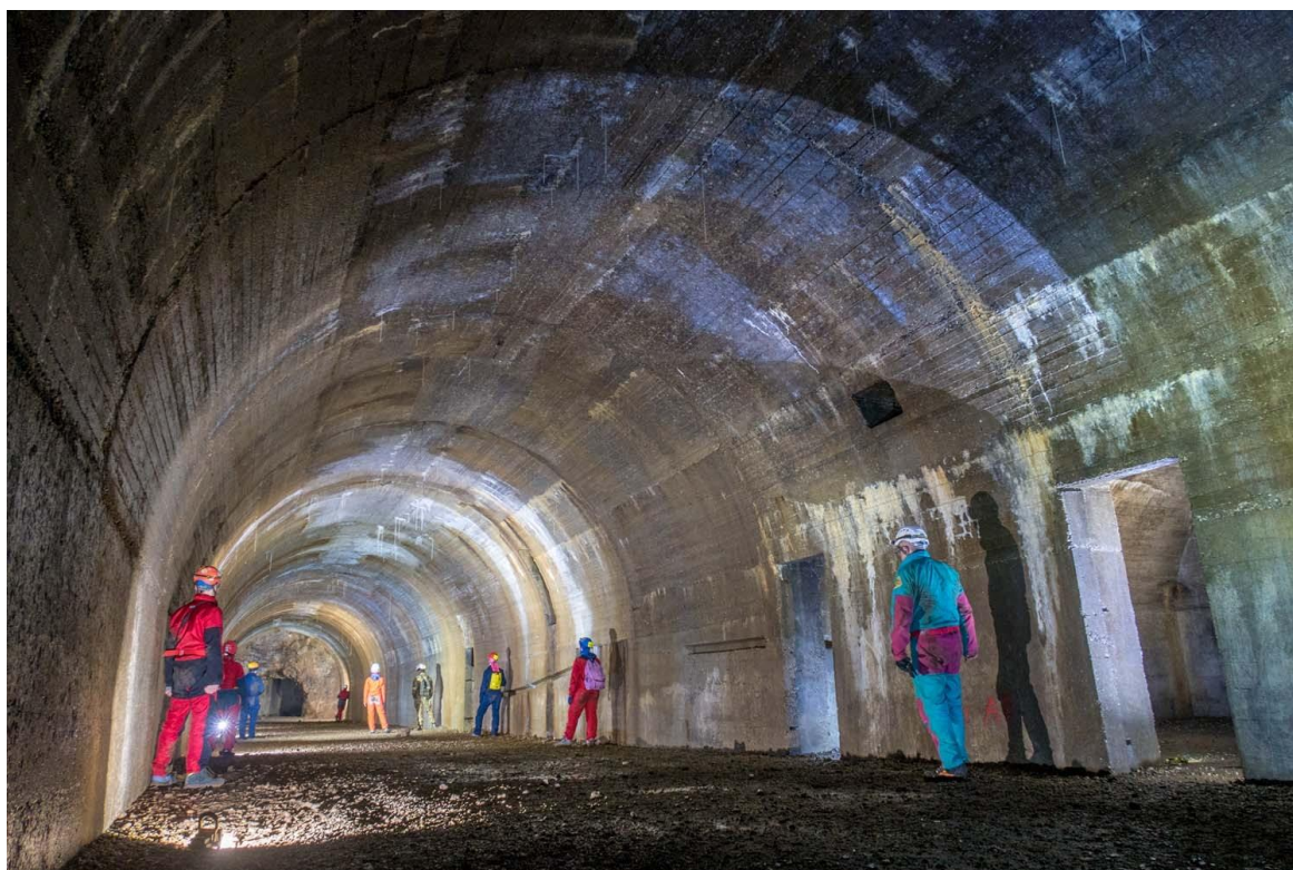
Figura 12: Visita e documentazione fotografica al rifugio antiaereo a Monfalcone.