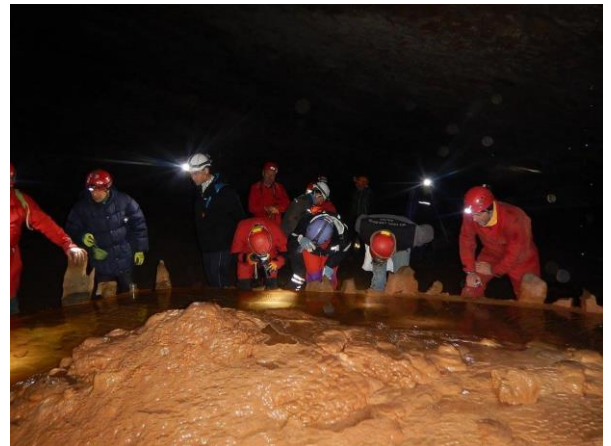
Figura 9: Corso di 2° livello "Vita sotto il carso, vademecum per gli speleologi".