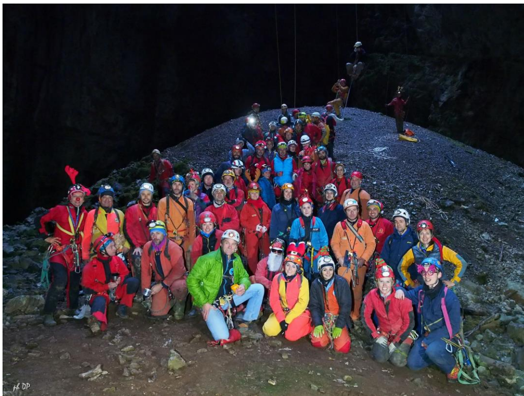
Figura 13: Scambio degli auguri natalizi tra gruppi.

Il 17.12.2017 abbiamo partecipato all'evento che ha coinvolto molte associazioni speleologiche regionali, per lo scambio di auguri natalizi nella Grotta Noè che ha visto la partecipazione di circa 80 speleologi appartenenti a vari gruppi speleo FVG.