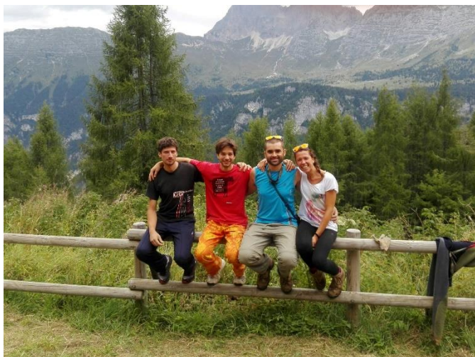
Figura 4: I nostri soci davanti alla Casera Goriuda. Foto di Furio Premiani (GSSG).

I soci sopraelencati, più Francesco Serafin, hanno aderito ad un campo di una settimana presso la casera Goriuda di sopra (Complesso del Monte Canin). Nel corso di questo campo, organizzato principalmente dal GSSG e dal GTS, sono state portate avanti le esplorazioni del complesso della grotta Clemente (appartenente al complesso del Foran del Muss) (n. Catasto 7788); sono state inoltre fatte delle punte esplorative, il disarmo e il rilievo definitivo della grotta Lazzaro 2 la Vendetta (n. Catasto 5693). Oltre alla partecipazione dei soci la nostra società ha contribuito sia con materiali sia economicamente per il trasporto degli stessi con l'elicottero.