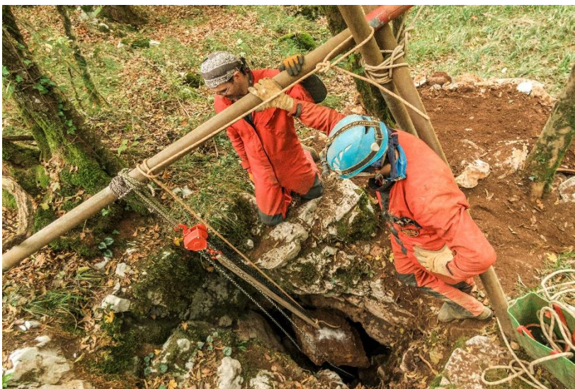
Figura 6: Attività di scavo.