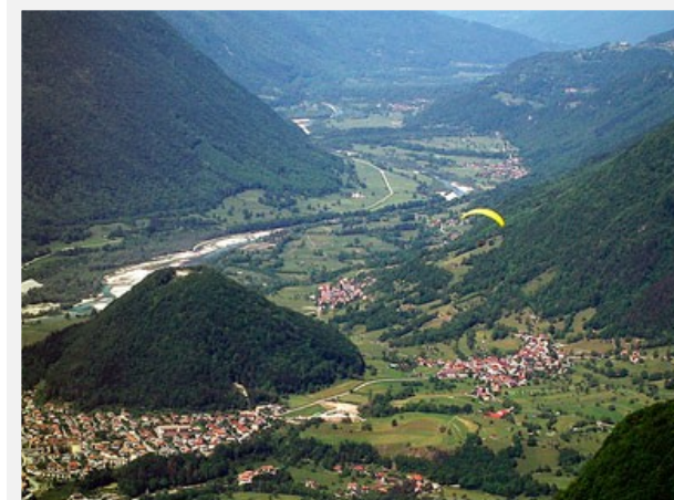
Il paesaggio della valle di Tolmino

Nella prima parte la grotta è attrezzata con scalini e funi passamani.