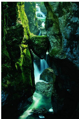
Medvedova glava, ponte naturale fatto di grandi massi incastrati fra le pareti del canyon della Zadlaščica