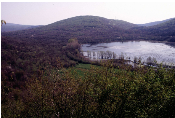
Il lago di Doberdò in piena

Normalmente la quota del fondo va da 3,5 a 5 metri dal livello medio marino, andando da ovest ad est.