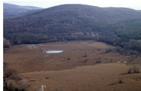
Il lago di Doberdò in magra

Anche idrologicamente possiede la sua importanza, le sue sorgenti più importanti sono poste a est del lago, mentre il sistema di inghiottitoi (quasi totalmente inaccessibili purtroppo), si trova a ovest. L'acqua della falda idrica del lago viene alimentata in maniera preponderante dal sistema del fiume Isonzo. Come per tutti i laghi carsici, si hanno fasi di piena e fasi di magra quasi estrema.