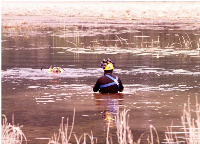
Esplorazioni speleosubacquee al lago di Doberdò.