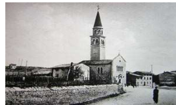
Immagine del paese di Doberdò agli inizi del '900

Con ritrovo alle ore 9,00 presso la sede sociale in via F.lli Cervi, n. 9/G 34077 Ronchi dei Legionari (GO) (area scolastica)